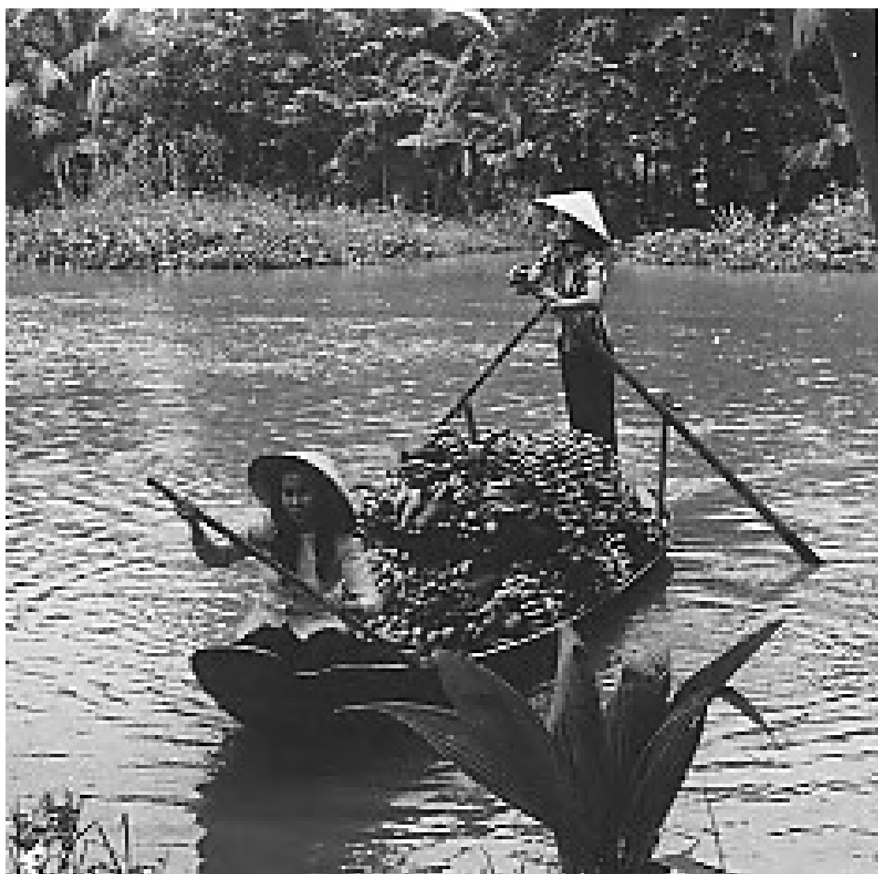
Ảnh: Trên Sông Rạch Long Xuyên